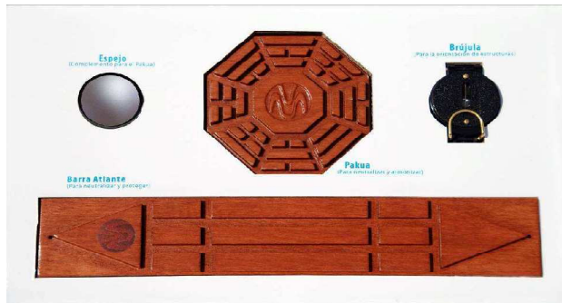
Interior del pack