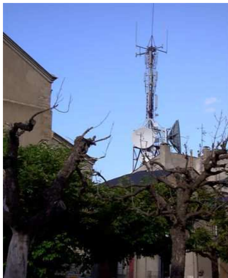
Antena de telecomunicaciones

Actualmente podemos afirmar que estamos rodeados de campos eléctricos y magnéticos, en nuestras viviendas y también en nuestros lugares de trabajo.